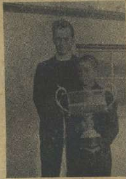
全国二位の君とブルカ先生

西京新聞社、日本学生英弁論大会、全日本中学校英語辯論大会は各地で争奪戦を繰り広げた。二十名が参加して十一月七日、日比谷公会堂で開会された。