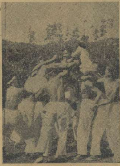
熱戦をたけなわ、高等学生の騎馬戦

本校第四回運動会十月十一日校庭に開かれ、生徒の熱心な準備と、親友の応援が、大会を盛り上げた。秋の空は晴れ、運動会は佳境に達した。各競技は、各校の選手が、それぞれに力をこめて競った。結果、本校は、各競技で、優勝を挙げた。これは、本校の歴史に、輝かしいページを添えた。この大会を通じて、各校の選手は、友情を深め、体力を鍛えた。本校の選手は、この大会で、大活躍した。これは、本校の誇りである。この大会を通じて、各校の選手は、友情を深め、体力を鍛えた。本校の選手は、この大会で、大活躍した。これは、本校の誇りである。