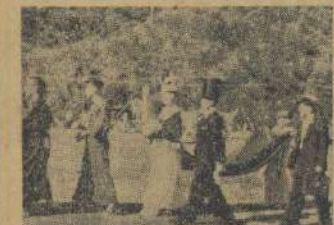
冠式部の演奏と主賓の祝言

この大会を通じて、各校の選手は、友情を深め、体力を鍛えた。本校の選手は、この大会で、大活躍した。これは、本校の誇りである。この大会を通じて、各校の選手は、友情を深め、体力を鍛えた。本校の選手は、この大会で、大活躍した。これは、本校の誇りである。