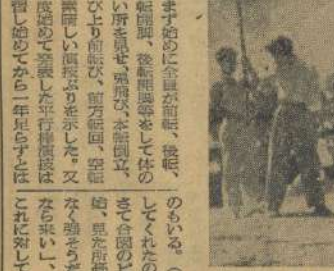
冠式部の演奏と主賓の祝言

この大会を通じて、各校の選手は、友情を深め、体力を鍛えた。本校の選手は、この大会で、大活躍した。これは、本校の誇りである。この大会を通じて、各校の選手は、友情を深め、体力を鍛えた。本校の選手は、この大会で、大活躍した。これは、本校の誇りである。