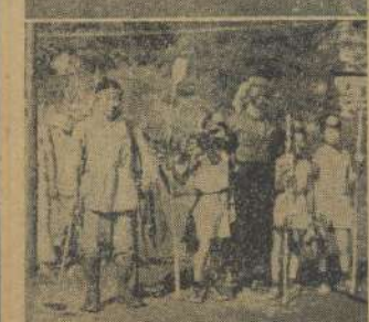
冠式部の演奏と主賓の祝言