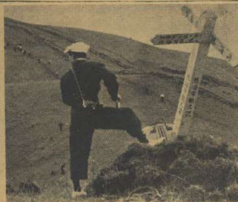
（左）は、ゆくり休息中。 望月の二十七日（右）は、ゆくり休息中。

昭和二十九年夏季遠足は五月二十六日、二十七日に行われ、今回は目的地を移度から近郊の遊園地へ。