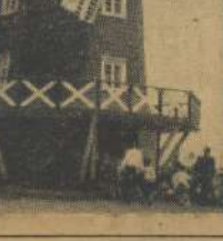
ユネスコ村のオランダ風車

玄岳の山頂、初めての演芸会。子供たちの声、笑い、そして、山風が吹く。玄岳の山頂、初めての演芸会。子供たちの声、笑い、そして、山風が吹く。玄岳の山頂、初めての演芸会。子供たちの声、笑い、そして、山風が吹く。