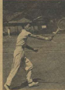
決勝試合の様子。本校の選手が力強いショットを放つ瞬間。

四月二十四日から二十五日、横浜と対戦した神奈川硬庭選手権大会が、二十七日に閉幕した。この大会は、神奈川硬庭協会主催で、県内各高校から選手が集り、激戦を繰り広げた。結果、本校が単複組ともに優勝を収めた。 決勝試合は、本校と横浜の対戦であった。本校は、第一セットから優勢に戦い、第二セットでも優勢に戦い、最終的に三セットすべてを奪取し、優勝を収めた。 この大会を通じて、本校の硬庭部員は、精神力と技術の面で、県内各高校と競り合った。今後の練習で、さらなる成長を遂げたい。